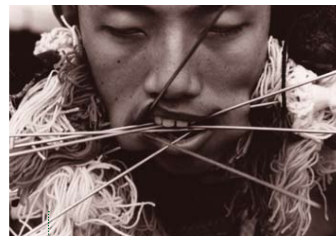
Vegetarian Festival, Thailand (Exaltation, 1999)